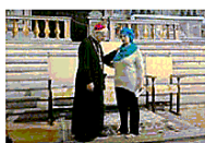
Musulmani a messa