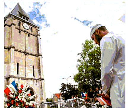
Un musulmano in silenzio davanti alla chiesa di Saint Etienne