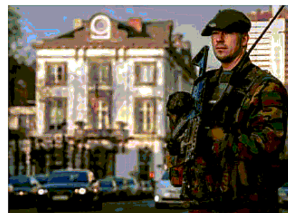
Dopo gli attentati si sono innalzate le misure di sicurezza a Bruxelles